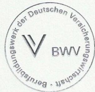
Vorsitzender des Vorstandes

Berufsbildungswerk der Deutschen Versicherungswirtschaft (BWV) e.V.